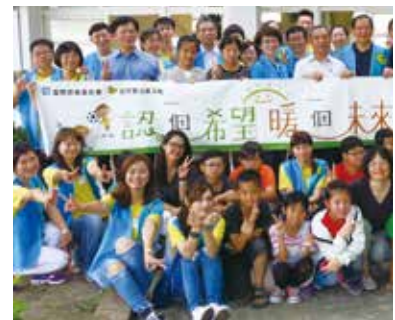
▲ 「認一個希望·暖一個未來」嘉義縣景山國小振寮分校「校園彩繪」任務，圓滿成功！