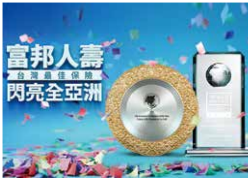
▲ 富邦人壽囊括國內外多項大獎，逐步邁向國際企業之典範