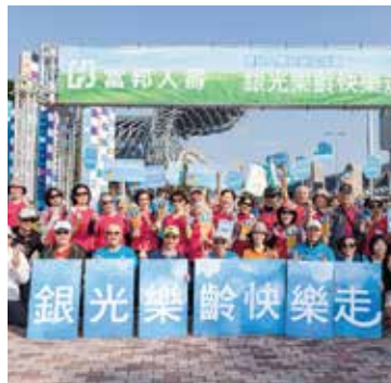
▲ 富邦人壽長期於全台舉辦在地生活圈講座及健走活動，傳遞樂齡概念