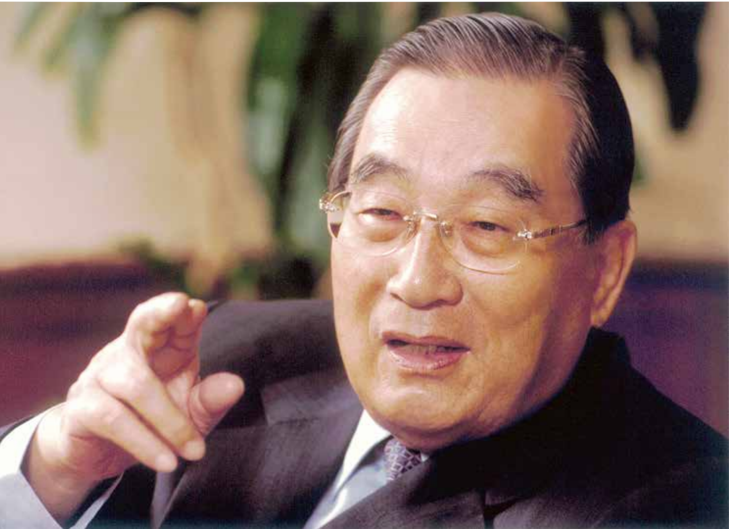
富邦集團 故總裁暨創辦人 蔡萬才