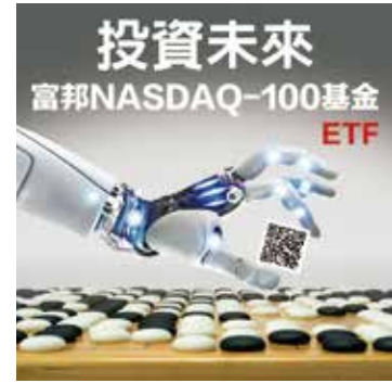
▲ 富邦投信 2016 年發行國內第一檔 NASDAQ-100 ETF