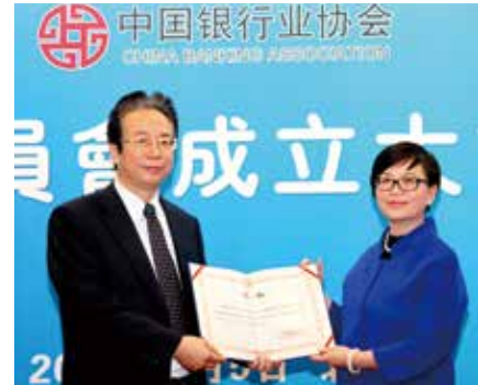
▲ 富邦華一銀行被推選為中國銀行業協會台資銀行工作委員會首屆常委會主任單位