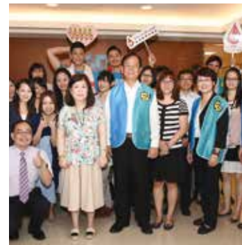
▲ 富邦產險挽起衣袖捐出熱血，將正向力量散播各處