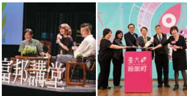
▲ 2016 富邦講堂邀請 21_21 DESIGN SIGHT「單位展」策展團隊來台