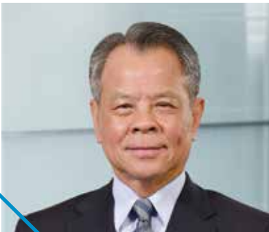
陳燦煌 富邦產險董事長