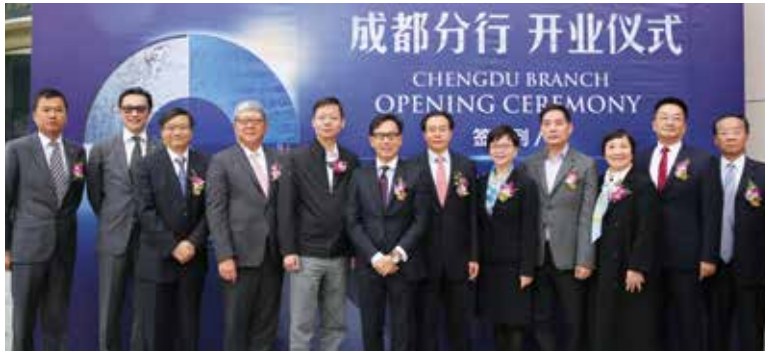
▲ 富邦華一銀行成都分行正式開業，為四川首家台資財富管理銀行