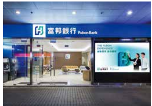
▲ iBranch自推出後廣受客戶歡迎。同時，富邦銀行（香港）亦已於香港成功獲取「iBranch」為其註冊商標