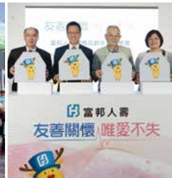
▲ 提供全方位整合服務，建構高齡關懷守護網絡、共創銀光樂活社會

2016年富邦人壽面對微利環境，仍以穩健經營策略締造亮眼佳績，稅後盈餘達286.88億元（EPS約為4.13元），初年度保費收入達2,043億元，總保費收入達4,936億元。同時在營運、專業服務及社會關懷皆獲國內外獎項肯定，包括從亞太區15國中脫穎而出，獲《亞洲保險論壇雜誌》評比為「2016亞洲最佳壽險公司」及「亞洲最佳業務員育成保險公司」、五度榮獲《世界金融雜誌》「台灣最佳保險公司」、連六年蟬聯「保險龍鳳獎」全國財金保險系所畢業生最嚮往壽險公司第一名、囊括保險信望愛獎16項大獎，業界表現最為亮眼，並獲天下雜誌「2016網路服務滿意度」評為人壽保險業第一名，逐步邁向國際企業之典範。