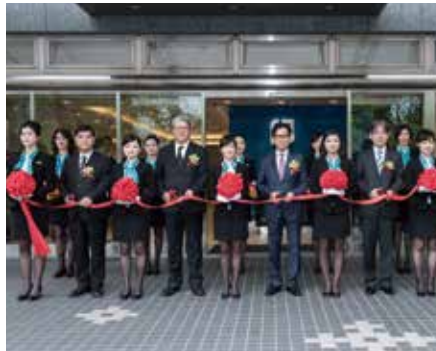
▲ 屏東分行歡慶開幕