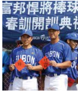
▲ 富邦悍將棒球隊正式進軍中華職棒，為力挺台灣棒球成長發展