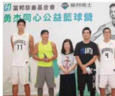
▲ 富邦慈善基金會代言人周杰倫與富邦勇士籃球隊攜手用正向的力量帶領孩子勇敢逐夢