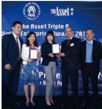
▲ 榮獲《財資雜誌 (The Asset)》頒發 2015 年亞太區「年度最佳行動銀行」