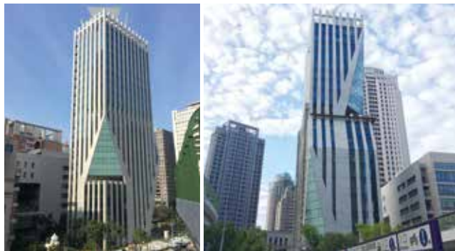
▲ 台中文心辦公大樓