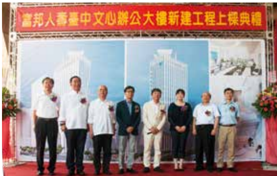
▲ 富邦人壽臺中文心辦公大樓新建工程上梁典禮