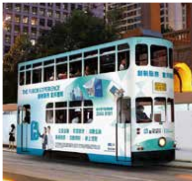
▲ 2016年推出以「創新服務 富邦體驗」為主題的品牌形象廣告