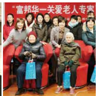
▲ 「富邦華一關愛老人專案」獲得社區及婦聯的一致好評