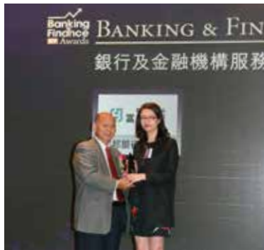
▲ 於2016年獲獎連連，未來會繼續提升服務質素，為客戶帶來獨特的「富邦體驗」