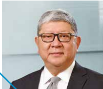
陳聖德 台北富邦銀行董事長