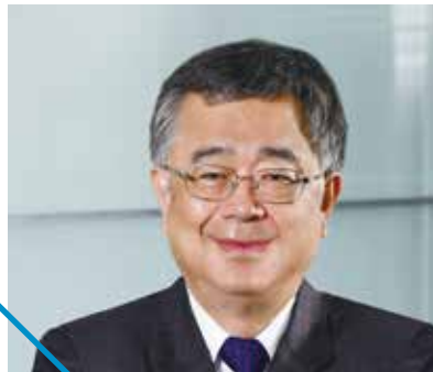
林福星 富邦人壽副董事長