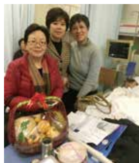
▲ 將愛心及資源傳遞給最需要幫助的弱勢女性群體

未來一年，基金會將在繼續做好「富邦華一關愛老人專案」的同時，開展「閱讀，讓心更暖」公益捐書活動，發動富邦華一銀行同仁及社會愛心人士共建偏遠地區鄉村學校圖書館。