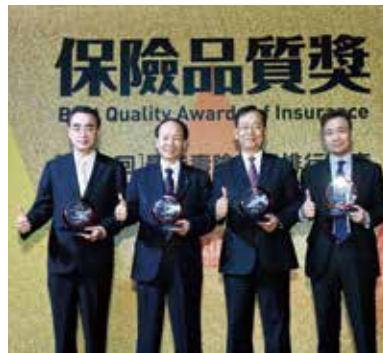
▲ 以專業服務及優質損防，連續十六屆榮獲千大企業最推崇的產險公司