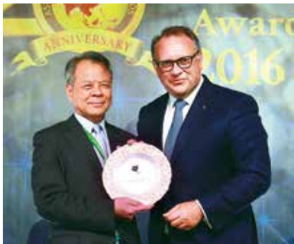
▲ 富邦產險為亞洲唯一三度榮獲《亞洲保險論壇》「年度最佳產險公司」的保險公司