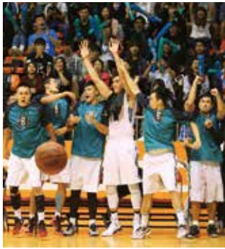
▲ 富邦勇士隊以「勇不止息」為核心精神，傳遞勇氣與夢想的正向力量