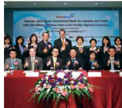
▲ Vietin Bank 越南工商銀行美金 2 億元聯貸簽約