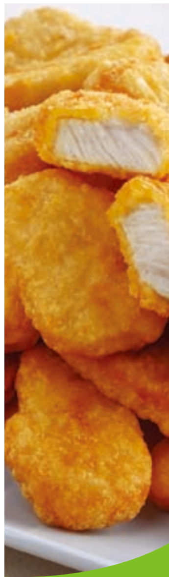
食品質檢透明 (瑞士SGS認證)