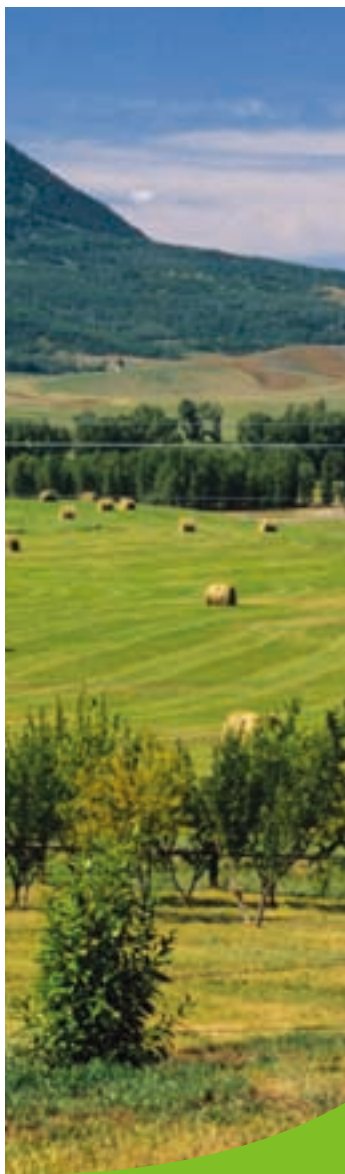
農場主人/地點透明